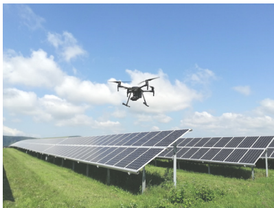
Рис. 2 – Контроль стану сонячних модулів за допомогою БПЛА

планування їх моніторингу для оцінки виявлених недоліків. При цьому також задіяні БПЛА з тепловізором для контролю стану сонячних модулів (рис. 2).