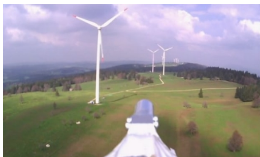
Рис. 3 – Вибір оптимального місця для установки вітроелектрогенераторів

Ефективність використання вітроелектрогенераторів значною мірою залежить від правильного вибору місць для їхньої установки [8,9].