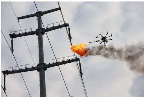
Рис. 4 – Очищення високовольтних мереж за допомогою БПЛА з вогнететом

Розробники мають намір адаптувати ці квадрокоптери для очищення лопатей вітроелектрогенераторів – від бруду у теплих країнах, й від льоду у холодних. Квадрокоптери можуть працювати, отримуючи живлення з землі (рис. 5), або в автономному режимі.