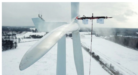
Рис. 5 – Очищення БПЛА лопатей вітроелектрогенераторів

Розробники мають намір адаптувати ці квадрокоптери для очищення лопатей вітроелектрогенераторів – від бруду у теплих країнах, й від льоду у холодних. Квадрокоптери можуть працювати, отримуючи живлення з землі (рис. 5), або в автономному режимі.