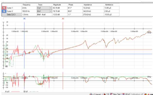
Рис. 2 – Графіки залежності діагностичних частотних параметрів трансформатора ТМ – 6300/110 від частоти (отримані шляхом використання приладу FRAnalyzer)

Тому такий трансформатор потребує подальших поглиблених обстежень з метою обґрунтування умов подальшої експлуатації та обслуговування.