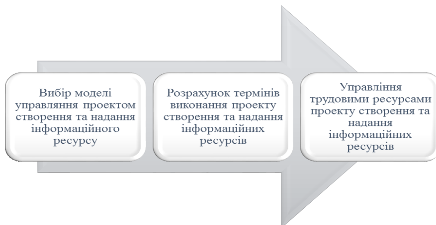
Рис. 1 – Реалізація менеджера проектів