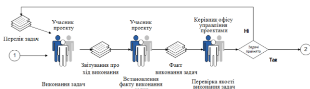
Рис. 2 – Процес «Реалізація» мотивації учасників проектного управління

До процесу Реалізація входять підпроцеси «Виконання задач», «Встановлення факту виконання задач», «Перевірка якості виконання задач» (рис.2).