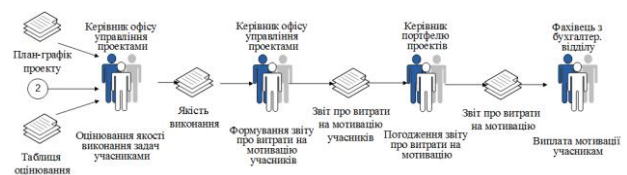
Рис. 3 – Процес «Звітність» мотивації учасників проектного управління

До процесу Звітність входять підпроцеси «Оцінювання якості виконання задач», «Формування звіту про витрати на мотивацію», «Погодження звіту про витрати на мотивацію», «Виплата мотивації учасникам» (рис.3).