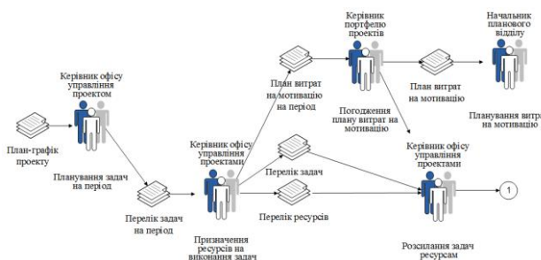
Рис. 1 – Процес «Планування» мотивації в управлінні проектом

До процесу Планування входять підпроцеси «Планування задач на період», «Призначення ресурсів на виконання задач», «Погодження плану витрат на мотивацію», «Розсилання задач ресурсам» (рис. 1).