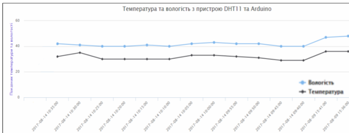
Рис. 3 – Графік відображення даних температури та вологості

отримані данні будуть зберігатися в розробленій базі даних, в нашому випадку у phpMyAdmin.