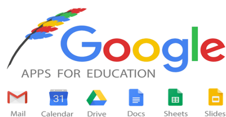
Рис. 2 – Інструменти Google Apps

Компанія Google також ініціювала дві важливі кампанії, спрямовані на вдосконалення освіти. Chromebook for Education - один з найважливіших проектів Google в рамках освітньої ініціативи. Chromebook представляє собою компактний ноутбук на основі операційної системи Chrome OS в посиленому виконанні, призначений для учнів та потреб освіти. Інша важлива ініціатива Google - це планшети з Google Play for Education, що дають педагогам змогу поступово впроваджувати останні технологічні рішення в навчальний процес та