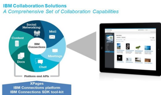
Рис. 4 – Інструменти IBM Collaboration Solutions

Корпорація IBM пропонує програмне забезпечення IBM Collaboration Solutions , що надає своїм користувачам можливість швидкого впровадження у навчально-виховний процес сучасних інноваційних рішень (електронна пошта, онлайн-спільноти, календар, веб-конференції, спільні документи) (рис. 4).