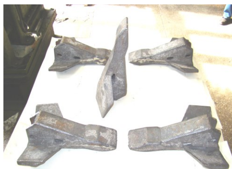
Рис. 4 – Лапы глубокого рыхления разрыхлителя «Soil Pro»

показали увеличение ресурса работы литых деталей по сравнению с оригиналами более, чем в 1,5 раза. Детали не выработали своего ресурса при вспашке в 2018 году и будут продолжать работу до полного износа в 2019 году. Кроме того, по заказу агрофирмы «Арника» было изготовлено опытно-промышленную партию лап культиватора для передачи фирме-производителю этой техники "Einbock" (Австрия) для проведения сертификационных испытаний и получения сертификата качества деталей из высокопрочного бейнитного чугуна, изготовленных по технологии ИПМ НАН Украины. Были проведены также сравнительные испытания в ЧП им. Довженко литых рыхлителей глубокого рыхления культиватора «Soil Pro». Масса олівки 11,5 кг (рис. 4). Эти детали (оригинал) стоят 5500 грн. Наши расчеты показывают, что подобные детали, изготовленные из бейнитного высокопрочного чугуна, в условиях серийного производства будут стоить в пределах 1500 грн.