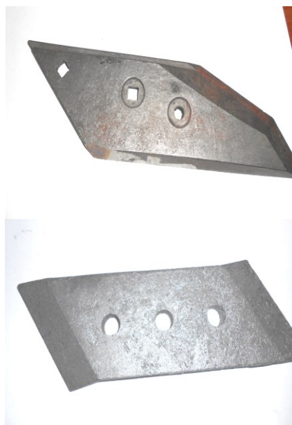
Рис. 3 – Насадки на лемеха фирм «Lemken»(а) и «Gregorie Besson»(б). Масса деталей – 2кг

Фирмой ООО «Лан-Агро» в 2017 году были дополнительно заказаны новые опытные образцы насадок для лемехов производства компании Gregorie Besson" и «Lemken» (рис. 3). Предприятием «Агромаш» было изготовлено по 350 шт. насадок на лемеха указанных фирм общей массой 1450 кг.