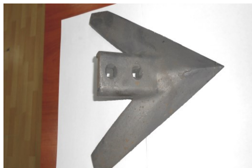
Рис. 2 – Литая лапа культиватора Great Plains. Масса детали - 2кг

агрофирме ООО «Лан-Агро» Полтавская область в количестве 200 шт.