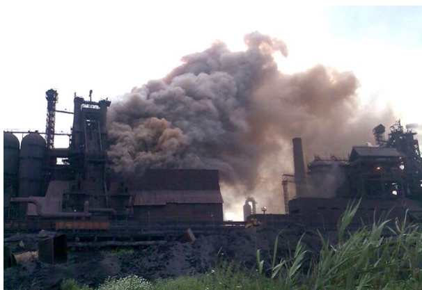
Рис. 2 – Атмосфера на МК «им.Ильича» в моменты выбросов

экстенсивный, а не интенсивный подход к решению экологических проблем. Несмотря на это они по-прежнему больше всех загрязняют окружающую среду. Кроме того, часто встречающийся в современных условиях непрофессионализм управленческого персонала меткомбинатов в производственных вопросах в некоторых случаях также может привести к повышению (или иногда к снижению) вредных выбросов.