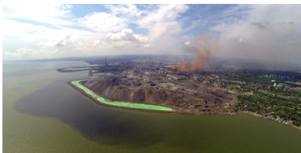
Рис. 3 – МК «Азовсталь» загрязняет воздух, воду (шлаковыми отвалами) и почву

В контексте вышесказанного и вне зависимости от объемов промышленного производства должно обеспечиваться высокое качество очистки вредных выбросов согласно установленным нормам и инструкциям.