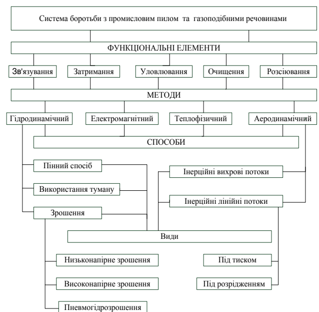
Рис. 1 – Класифікаційна схема боротьби з промисловим пилом і газоподібними викидами цементних заводів

І саме частки такого розміру (діаметром менше 10 мкм) відіграють велику роль в утворенні хмар смогу над мегаполісами в зимові періоди. Крім того, цементний і кам'яний пил суттєво погіршує видимість на дорогах, що збільшує ризик аварій і знижує швидкість руху. Ресурс двигунів, що працюють в умовах запилення, скорочується в 2-3 рази. Вплив пилу збільшує також інтенсивність процесу корозії. Це призводить до того, що обслуговування і ремонт техніки стають дорожче, складніше і триваліше.