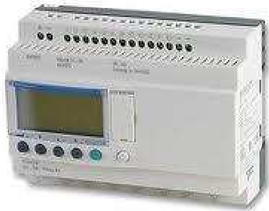
Рис. 1 – Програмований логічний контролер Zelio Logik

Програмований логічний контролер (англ. Programmable Logic Controller (PLC) ) – електронний пристрій, який використовується для автоматизації технологічних процесів таких як, управління конвеєрною лінією, насосами на станціях водопостачання верстатами з числовим програмним керуванням тощо. Він є спеціалізованим комп'ютером реального часу, який розроблений на основі мікроконтролера. Його відмінністю від комп'ютерів загального призначення є значна кількість пристроїв вводу-виводу для датчиків та виконавчих пристроїв, а також можливість надійної роботи при несприятливих умовах (широкий діапазон температур, висока вологість, сильні електромагнітні завади, вібрації тощо) [9].