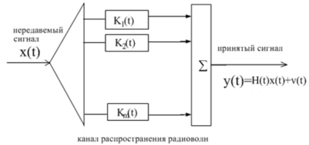
Рис.2. Эквивалентная структура системы передачи сигнала x(t) через многолучевой канал связи (2)

где K_m - ядра Вольтерра, для стационарного случая симметричны по всем переменным. Структурная схема, реализующая процедуру (1) представлена на рис.2.