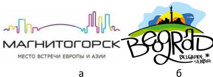
Рис. 4 – Примеры использования рельефа местности в логотипе: а – логотип г. Магнитогорск; б – г. Белград

Национальный флаг также может послужить источником для идеи, как при создании туристического бренда Канады (рис. 7, а) или логотип управления туризмом в Великобритании (рис. 7, б).