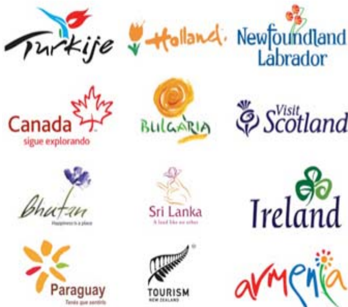
Рис. 8 – Пример использования флоры и фауны для логотипа