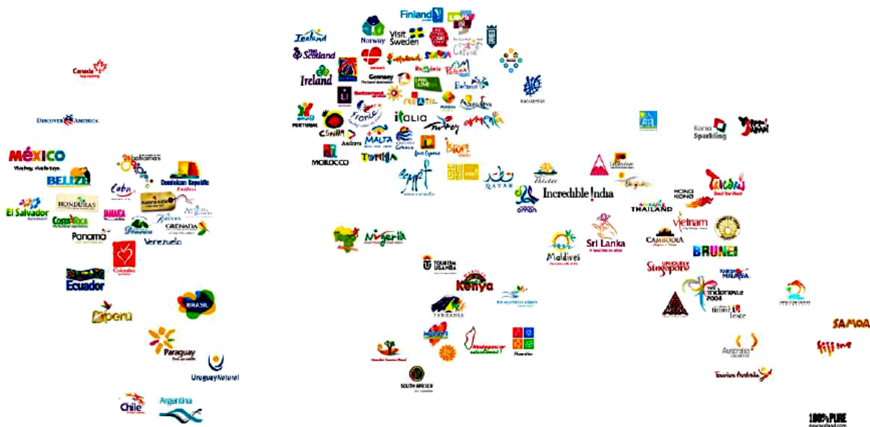
Рис. 3 – Карта мировых территориальных брендов

Для отображения ключевой идеи бренда элементы внешней идентификации должны быть актуальными, запоминающимися и практичными. На этапе создания логотипа нужно отойти от традиционных символов города и придумать что-то более броское и уникальное, для достижения целей поставленных при рестайлинге городского пространства. Существует множество городов, имеющих свою яркую, грамотно выраженную индивидуальность на мировом «полотне» (рис. 3).