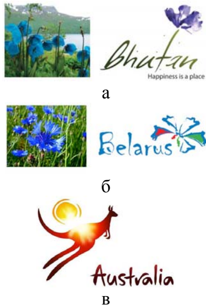
Рис. 9 – Примеры логотипов с растениями и животными: а – Бутан; б – Беларусь; в – Австралия

4. Копирайтинг и шрифтовые решения. Иногда, при создании бренда достаточно просто удачно подобрать шрифтовое и цветовое решения композиции, которое поможет создать соответствующую эмоцию от логотипа территории. Для примера можно рассмотреть Мехико, Эквадор и другие города, представленные на рис. 10.