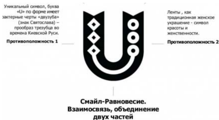
Рис. 12 – Символизм украинского логотипа

Исходя из этой концепции, графический символ Украины – буква U – первая буква названия страны на английском. Также буква дополняется двумя символическими элементами: магнитом и смайлом, которые обозначает действие притягивания туристов в Украину своей широкой улыбкой. Цветовое решение логотипа – яркое, отображающее уникальный национальный колорит Украины. Символизм также присутствует и в самом графическом знаке: буква U – «двузуб» – прообраз трезубца во времена Киевской Руси; ленты – символ традиционного украинского женского украшения; две противоположности – Западная и Восточная Украина и смайл – символ их объединения (рис. 12).