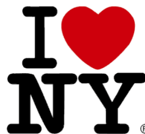
Рис. 2 – Логотип города Нью-Йорк