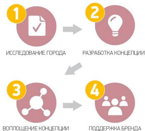
Рис. 1 – Этапы создания территориального бренда

делает штат самым известным и популярным в мире местом. Одной из причин такого успеха послужил правильный логотип, представляющий собой ребус, состоящий из букв I, красного символа сердца, и заголовочных букв N и Y. Для логотипа использован шрифт с засечками American Typewriter.