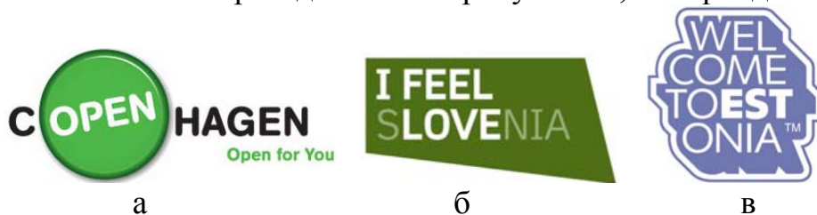
Рис. 11 – Использование копирайтинга в логотипе: а – Копенгаген; б – Словения; в – Эстония

демонстрирующий любовь к Словении, а на рисунке 11, в – Эстония, логотип которой приглашает посетить эту страну.