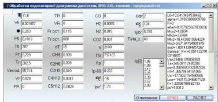
Рис. 2 – Диалоговое окно программы обработки индикаторных диаграмм

Обработка индикаторных диаграмм с целью получения характеристики тепловыделения производилась с помощью методики, описанной в [7]. На рис. 2 приведено диалоговое окно программы обработки индикаторных диаграмм, созданной с использованием