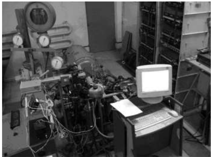
Рис. 1 – Экспериментальный стенд для исследования автомобильного биогазового ДВС

Для получения уравнения переменного показателя сгорания для биогазового двигателя было выполнено экспериментальное исследование на моторном стенде, созданном на базе малолитражного биогазового ДВС (рис. 1). Последний был получен переводом на биогаз малолитражного автомобильного двигателя МеМЗ-307. В результате исследования были получены индикаторные диаграммы для 80 режимов работы двигателя.