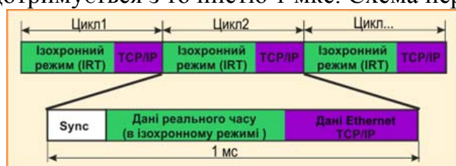
Рис. 4. Організація обміну даними в PROFINET IRT

Передача даних контролюється майстром мережі, час циклу - 1 мс і дотримується з точністю 1 мкс. Схема передачі даних зображена на рис. 4.