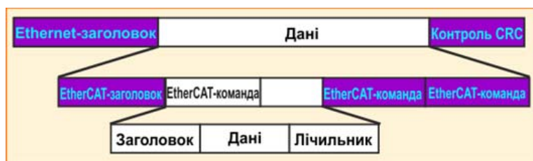
Рис. 3. Формат даних в протоколі EtherCAT

Майстер мережі (ведучий пристрій) організовує обмін даними циклічно. Дані EtherCAT передаються у вигляді кадрів, заповнених в стандартні телеграми Ethernet, але з великим пріоритетом. Ведені пристрої в мережі тільки виконують команди ведучого. Формат даних в EtherCAT представлений на рис. 3.