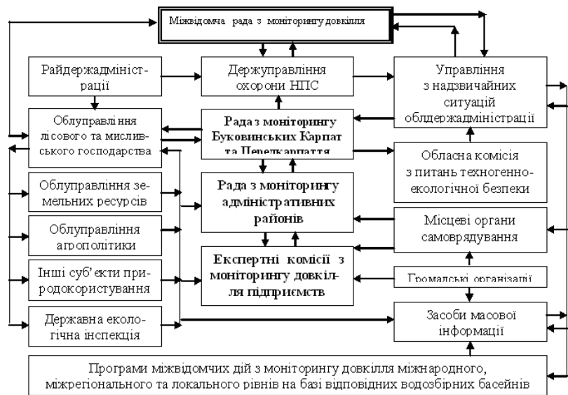
Рис.3. Схема удосконалення системи моніторингу Буковинських Карпат та Передкарпаття.

Таким чином розроблення в межах ОСМД підсистеми «Моніторинг Буковинських Карпат», спрямованої на вдосконалення мереж спостереження, забезпечить запобігання надзвичайних ситуацій, а також забруднення довкілля в межах водозборів, що знижує ризики розвитку цих явищ відповідних водозбірних басейнів.