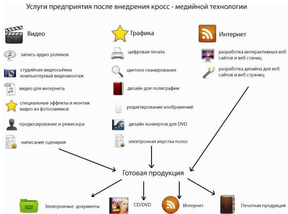
Рис. Услуги предприятия после внедрения кросс-медийной технологии

монтажа видеоизображен и Т.Д. Благодаря этому, компания может размещать информацию о своей продукции как на печатных носителях так и размещать ее в сети Интернет и на телевидении, а так же использовать в эфирное время на FM радио.