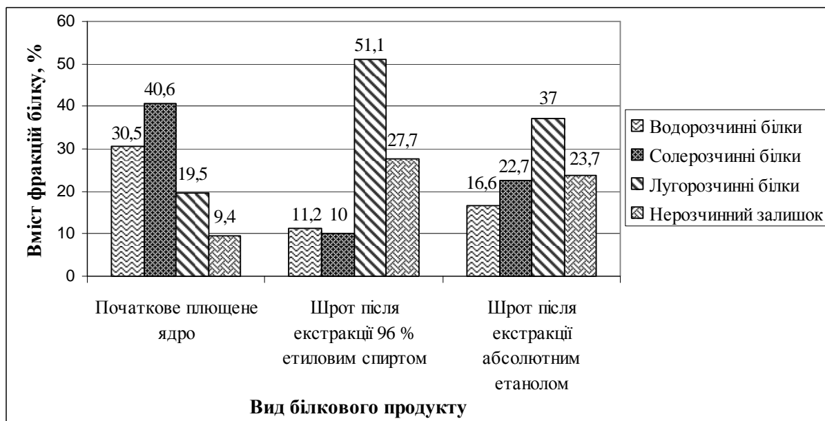
Рис. 1. Залежність вмісту фракцій білка від виду білкового продукту

З рисунку видно, що обидва зразка шроту після екстракції значно втрачають кількість водо- і солерозчинних білків у порівнянні з вмістом цих білків у початковому ядрі, разом з тим за рахунок зниження цих білків вміст лугорозчинної фракції і нерозчинного залишку збільшується, що вказує на протікання процесу денатурації.