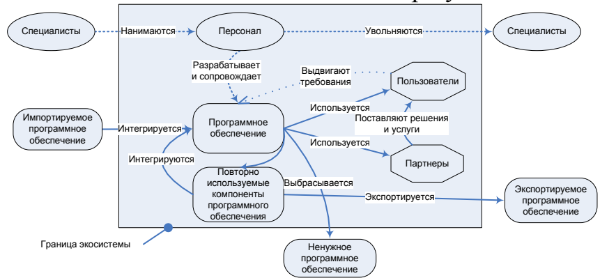
Рис. 2. Мерологическая модель экосистемы программного обеспечения

или масштаба государства; для экосистем меньшего размера большинство из них будут средой. Во-вторых, определение сред на входе и выходе в модели позволяет выявлять и описывать существенные связи экосистемы со средой, объемы и состав обмена. При этом, вопрос справедливости для экосистем программного обеспечения закономерностей, присущих биоэкосистемам, например, уменьшение зависимости системы от внешних частей при увеличении размера [9], требует отдельного исследования. На рис. 2 представлена обобщенная мерологическая модель экосистем программного обеспечения. Предлагаемая модель позволяет показать элементы, принадлежащие экосистеме и обмен между ними. Как и для холистической модели (рис.1) важнейшим вопросом является выбор сущностей, которыми обмениваются элементы системы.