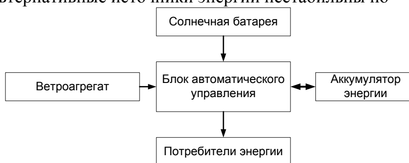
Рис.1 - Схема ветросолнечной автономной энергоустановки с накоплением энергии.

Ввиду того, что в определенный момент работы автономной энергоустановки единственным источником энергии для потребителя может оказаться аккумулятор, его надежность является весьма важной. Поэтому не маловажным аспектом в организации автономных систем энергоснабжения является контроль и оперативная диагностика аккумулятора, то есть автоматизированный контроль и учёт ресурса. Это даст возможность вовремя